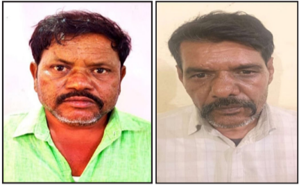
ಉತ್ತರ ವಲಯದಲ್ಲಿ ಜೂನ್ 21ರಿಂದ 28 ರವರೆಗೆ ಡ್ರಗ್ಸ್ ಜಾಗೃತಿ ವಾರ | 16 ಪ್ರಕರಣ ದಾಖಲು