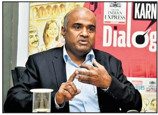
ಗಣತಿ ಫಾರಂಗಳನ್ನು ಮತದಾರರಿಗೆ ಸಕಾಲದಲ್ಲಿ ತಲುಪುವಂತೆ ನೋಡಿಕೊಳ್ಳಲು ಸಂಬಂಧಪಟ್ಟ ಎಲ್ಲಾ

ಬೆಂಗಳೂರು: ರಾಜ್ಯಾದ್ಯಂತ ಶೇ.80.85ರಷ್ಟು ಎಣಿಕೆ ಫಾರಂಗಳನ್ನು ಈಗಾಗಲೇ ಮತದಾರರಿಗೆ ವಿತರಿಸಲಾಗಿದೆ ಎಂದು ಕರ್ನಾಟಕ ಮುಖ್ಯ ಜುನಾವಣಾ ಅಧಿಕಾರಿ ವಿ ಅನುಕುಮಾರ್ ಹೇಳಿದ್ದಾರೆ. ಜುನಾವಣಾ ಆಯೋಜನಾ ನಿರ್ದೇಶನದಂತೆ, ಮತದಾರರ ಪಟ್ಟಿಯ ಎಸ್‌ಐಆರ್ ಅಡಿಯಲ್ಲಿ ಮನೆ-ಮನೆಗೆ ತೆರಳಿ ಎಣಿಕೆ ಕಾರ್ಯ ಜೂನ್ 30ರಂದು ಪ್ರಾರಂಭವಾಗಿದ್ದು ಜುಲೈ 29ರವರೆಗೆ ಮುಂದುವರಿಯುತ್ತದೆ ಎಂದರು. ಬುಧವಾರ ಪತ್ರಿಕಾಗೋಷ್ಠಿಯನ್ನು ದೇಶಿ ಮಾತನಾಡಿದ ಅನುಕುಮಾರ್, ನಾವು ಕರ್ನಾಟಕದ ಪ್ರತಿಯೊಂದು ಮನೆಗೆ, ಪ್ರತಿಯೊಬ್ಬ ಮತದಾರರಿಗೆ ಎಣಿಕೆ ಫಾರಂಗಳನ್ನು ವಿತರಿಸುತ್ತೇವೆ. ಆ ಪ್ರಕ್ರಿಯೆಯಲ್ಲಿ ಶೇ.80.85ರಷ್ಟು ಎಣಿಕೆ ಫಾರಂಗಳನ್ನು ಈಗಾಗಲೇ ಕರ್ನಾಟಕದ ಮತದಾರರಿಗೆ ವಿತರಿಸಲಾಗಿದೆ ಎಂದರು. 224 ವಿಧಾನಸಭಾ ಕ್ಷೇತ್ರಗಳ ಪೈಕಿ 112 ಕ್ಷೇತ್ರಗಳಲ್ಲಿ ಶೇಕಡ 90ಕ್ಕೂ ಹೆಚ್ಚು ಫಾರಂಗಳನ್ನು ವಿತರಿಸಲಾಗಿದೆ. ಅದರ 169 ಕ್ಷೇತ್ರಗಳಲ್ಲಿ ಶೇಕಡ 80ಕ್ಕೂ ಹೆಚ್ಚು ಫಾರಂಗಳನ್ನು ಈಗಾಗಲೇ ವಿತರಿಸಲಾಗಿದೆ ಎಂದರು. ಗಣತಿ ಫಾರಂಗಳನ್ನು ಮತದಾರರಿಗೆ ಸಕಾಲದಲ್ಲಿ ತಲುಪುವಂತೆ ನೋಡಿಕೊಳ್ಳಲು ಸಂಬಂಧಪಟ್ಟ ಎಲ್ಲಾ