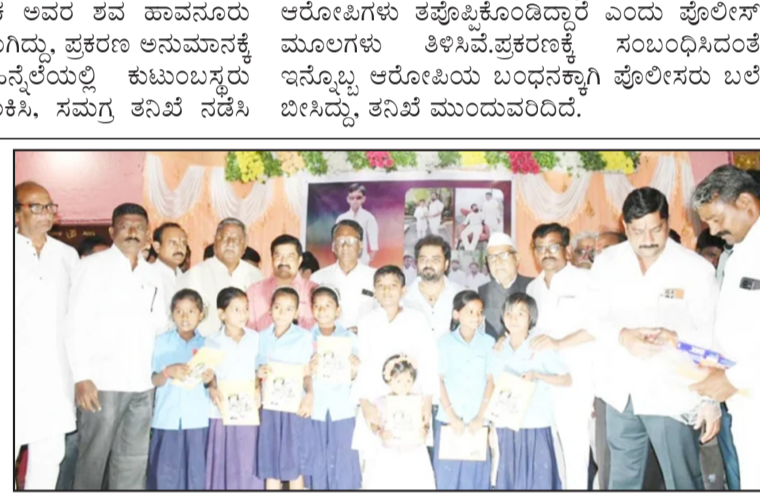
ಮಾಡಿರುವುದು ಅತ್ಯಂತ ಶ್ಲಾಘನೀಯ ಕಾರ್ಯ. ಇಂತಹ ಸಮಾಜಮುಖಿ ಕಾರ್ಯಗಳು ಇತರರಿಗೂ ಪ್ರೇರಣೆಯಾಗಲಿ" ಎಂದು

ನಾಪತ್ತೆಯಾಗಿದ್ದು, ಬಳಿಕ ಅವರ ಶವ ಹಾವನೂರು ಗ್ರಾಮದ ಸಮೀಪ ಪತ್ತೆಯಾಗಿದ್ದು, ಪ್ರಕರಣ ಅನುಮಾನಕ್ಕೆ ಕಾರಣವಾಗಿತ್ತು. ಈ ಹಿನ್ನೆಲೆಯಲ್ಲಿ ಕುಟುಂಬಸ್ಥರು ಇದು ಕೊಲೆ ಎಂದು ಶಂಕಿಸಿ, ಸಮಗ್ರ ತನಿಖೆ ನಡೆಸಿ