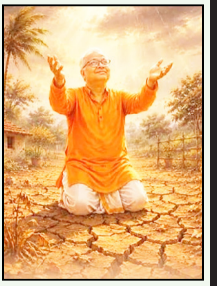
ಊರೇ ಒಗ್ಗೂಡಿ ಸಕಲ ದೇವಾನುದೇವತೆಗಳಲ್ಲಿ ವರುಣನಿಗಾಗಿ ಭಕ್ತಿಪೂರ್ವಕವಾಗಿ ವಿಶೇಷ ಪ್ರಾರ್ಥನೆ ಸಲ್ಲಿಸುತ್ತಾರೆ.

ಕೆಲ್ಲ ಮುಚ್ಚಿ ಕುಳಿತನೋ ವರುಣ ದೇವ, ಬೆಳೆ ಒಣಗಿ ಬಸವಳಿಯುತು ಜೀವ, ಕಾರ ಮಳೆಯ ಸುರಿಸಿ, ಕಪಟಿ ಮಳೆ ಕರಗಿಸಿ, ಧರೆಯ ಸಿರಿ ತಣಿಸು ವರುಣ ದೇವ ಎನ್ನುವ ಗ್ರಾಮೀಣ ಪ್ರದೇಶದಲ್ಲಿ ಮಳೆಗಾಗಿ ವರುಣ ದೇವನಿಗೆ ಮಳೆಳೆಯರು ಪ್ರಾರ್ಥನೆ ಮಾಡುವ ದೃಶ್ಯ ಕಂಡು ಬರುತ್ತದೆ. ಹಳ್ಳಿಗಾಡಿನ ಜನರು ಮಳೆಗಾಗಿ ಮೇಘರಾಜನನ್ನು ಪ್ರಾರ್ಥಿಸುವ ಸಾಂಪ್ರದಾಯಿಕ ಮತ್ತು ಭಕ್ತಿಪೂರ್ವಕವಾದ ಜಾನಪದ ಹಾಡು