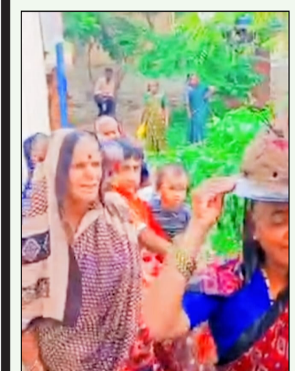
ಮಾನವ ಸಂಸ್ಕೃತಿಯ ತಾಯಿಬೇರು ಜನಪದ ಪರಂಪರೆ

ಶತಮಾನಗಳಿಂದಲೂ ಆಚರಣೆಯಲ್ಲಿರುವ ಗುರ್ಜಿ ಪೂಜೆಯು ವಿಶಿಷ್ಟವಾಗಿದೆ. ಮಳೆಳೆಯರು ಮತ್ತು ಬಾಲಕರು ತಲೆಯ ಮೇಲೆ ತವ ಇಟ್ಟುಕೊಂಡು, ಅದರ ಮೇಲೆ ಆಕಳ ಸೆಣೆಯಿಂದ ಗುರ್ಜಿ ತಯಾರಿಸಿ, ಗುರ್ಜಿ ಹಾಡು ಹಾಡುತ್ತಾ, ಪ್ರತಿ ಮನೆಗೆ ತೆರಳಿ ಗುರ್ಜಿಗೆ ನೀರು ಸುರಿದು ದೇವರಲ್ಲಿ ಜನರು ಮಳೆ ನೀಡಲೆಂದು ಬೇಡಿಕೊಳ್ಳುತ್ತಾರೆ. ಇದರಿಂದ ಸಂಕಷ್ಟ ಕಾಲದಲ್ಲಿ ಇಡೀ ರೈತ ಸಮುದಾಯಕ್ಕೆ ಧನಾತ್ಮಕ ಶಕ್ತಿಯನ್ನು ತುಂಬುತ್ತಾರೆ. ಅಷ್ಟೇ ಅಲ್ಲದೇ ಜಾತಿ, ಮತ, ಪಂಥ-ಪಂಗಡಗಳ ಬೇಧ-ಭಾವವಿಲ್ಲದೇ ಇಡೀ