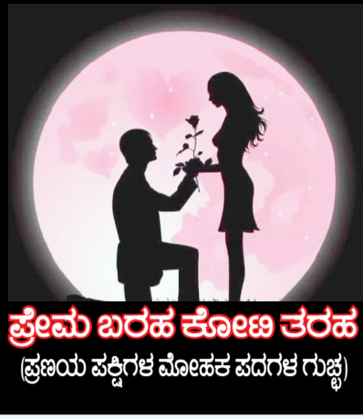
ಪ್ರೇಮ ಬರಹ ಕೋಣ ತರಕ ಪ್ರಣಯ ಪಕ್ಷಿಗಳ ಮೋಹಕ ಪದಗಳ ಗುಚ್ಛ

ನಿನ್ನ ಹೆಸರಿಂದಲೇ ನೀನು ಮಾತ್ರ ಸೀದಾ ಸಾದಾ ಹುಡುಗ. ಆದರೆ ನಡೆಯಲ್ಲಿ ಚುರುಕುತನ ಎದ್ದು ಕಾಣುತ್ತದೆ. ಪ್ರಶಾಂತತೆ ಎದ್ದು ಕಾಣುವ ಮುಖ, ಕಣ್ಣಲ್ಲಿ ಮಿನುಗುವ ಮುದ್ದು ಎಂಥ ಕಲ್ಲು ಹೃದಯದವರನ್ನೂ ಕರಗಿಸುತ್ತದೆ. ಸಿರಿವಂತಿ-ಕೆಗೂ ನಮ್ಮದಿಗೂ ಎಷ್ಟೇ ಸೀಗಿಕಾಯಿ ಸಂಬಂಧ ಆದರೆ ನೀನು ಮಾತ್ರ ಇಷ್ಟು ನಮ್ಮದಿಯಾಗಿ ಇದ್ದೀಯಲ್ಲ ಎಂದು ಹೆಮ್ಮೆಯಿಂದ ಹೇಳಿಕೊಂಡಿತ್ತು ಮನಸ್ಸು ದುಡ್ಡು ಆಸ್ತಿ ನೋಡಿ ಹೆಣ್ಣು ಕೊಡುವವರು ಮನೆ ಮುಂದೆ ಸಾಲು ಹಚ್ಚಿರುತ್ತಾರೆ. ಸಿರಿವಂತ ಮನೆತನದಿಂದಲೇ ಹೆಣ್ಣು ತಂದು ಮದುವೆ ಮಾಡುತ್ತೇವೆಂದು ಹಟ ಮಾಡುವ ಶ್ರೀಮಂತ ತಂದೆ ತಾಯಿಯರು