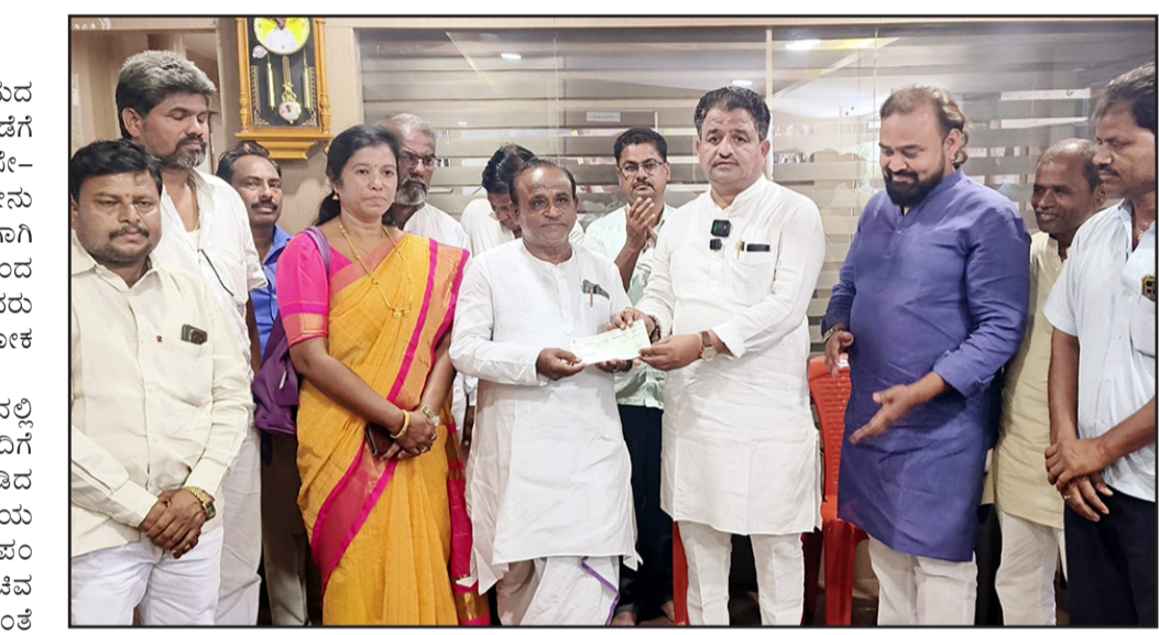
ಶಾಲೆಗಾಗಿ ಜಮೀನು ಖರೀದಿಸಬೇಕೆಂಬುದು ಗ್ರಾಮಸ್ಥರ ಆಶಯವಾಗಿತ್ತು. ಗ್ರಾಮಸ್ಥರು ಪ್ರೌಢಶಾಲಾ