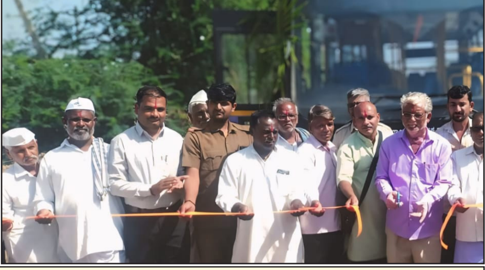
ಬೇನಾಳ ಗ್ರಾಮಸ್ಥರಿಂದ ಅಭಿನಂದನೆ: ಮನವಿಗೆ ಸ್ಪಂದಿಸಿ

ಉದಯರಶ್ಮಿ ದಿನಪತ್ರಿಕೆ ಅಲಮಟ್ಟಿ ಗ್ರಾಮಸ್ಥರ ಬಹು ದಿನಗಳ ಬೇಡಿಕೆಯಾಗಿದ್ದ ವಿಜಯಪುರದಿಂದ ಬೇನಾಳ ರೈಲು ನಿಲ್ದಾಣಕ್ಕೆ ನೂತನ ಬಸ್ ಸಂಚಾರ ( ಸೇವೆ ) ಸೇವೆ ಇಂದು ಆರಂಭವಾಗಿದೆ. ವರುಷದ ಹಿಂದೆ ಸಾರಿಗೆ ಇಲಾಖೆಯ ಅಧಿಕಾರಿಗಳಿಗೆ ಬೇನಾಳ ಆರ್. ಎಸ್. ಗ್ರಾಮಸ್ಥರು ಮನವಿ ಮಾಡಿಕೊಂಡಿದ್ದರು, ಮನವಿಗೆ ಸಂದಿಸಿದ ಅಧಿಕಾರಿಗಳು ಬಸ್ ಸಂಚಾರವನ್ನು ಆರಂಭಿಸಿದ್ದಾರೆ. ಈ ನೂತನ ಬಸ್ ಪ್ರತಿದಿನ ವಿಜಯಪುರ ಕೇಂದ್ರ ಬಸ್ ನಿಲ್ದಾಣದಿಂದ ಬೆಳಿಗ್ಗೆ 7:45ಕ್ಕೆ ಹೊರಟು 09: 30ಕ್ಕೆ ಅಲಮಟ್ಟಿ ಉದ್ಯಾನಕ್ಕೆ ತಲುಪುತ್ತದೆ. 09:45 ನಿಮಿಷಕ್ಕೆ ಉದ್ಯಾನದಿಂದ ಹೊರಟು 11: 30 ನಿಮಿಷಕ್ಕೆ ವಿಜಯಪುರವನ್ನು ತಲುಪುತ್ತದೆ. ಅದೇ ಬಸ್ಸು 11 : 45 ನಿಮಿಷಕ್ಕೆ ವಿಜಯಪುರವನ್ನು ಬಿಟ್ಟು 01: 30ಕ್ಕೆ ಅಲಮಟ್ಟಿ ಉದ್ಯಾನಕ್ಕೆ ಬರುತ್ತದೆ. ನಂತರ ಮಧ್ಯಾಹ್ನ 2 ಗಂಟೆಗೆ ಉದ್ಯಾನವನ್ನು ಬಿಟ್ಟು 3:30ಕ್ಕೆ ವಿಜಯಪುರವನ್ನು ತಲುಪುತ್ತದೆ. ಹೀಗೆ ಪ್ರತಿದಿನ 4 ಸಲ ಬಸ್ಸು ಸೇವೆಯನ್ನು ಒದಗಿಸುತ್ತದೆ. ನೂತನ ಬಸ್ ಸಂಚಾರದಿಂದ ಈ ಭಾಗದ ವಿದ್ಯಾರ್ಥಿಗಳಿಗೆ, ರೈತರಿಗೆ, ಕೂಲಿಕಾರ್ಮಿಕರಿಗೆ, ಮಹಿಳಾ ಉದ್ಯೋಗಿಗಳಿಗೆ ಬಹಳ ಸಹಾಯವಾಗಿದೆ. ವಿಜಯಪುರ ಕೇಂದ್ರ ಬಸ್ ನಿಲ್ದಾಣ ದಿಂದ ಹೊರಟ ಬಸ್ಸು ಜುಮನಾಳ ಕ್ರಾಸ್, ಹೊನಗನಹಳ್ಳಿ, ತೊನಶಾಳ ಕ್ರಾಸ್, ಮುಳವಾಡ ಪ್ರವಾಸಿ ಮಂದಿರ, ಮುಳವಾಡ, ಕಲಗುರ್ಕಿ, ಕಲಗುರ್ಕಿ ರೈಲು ನಿಲ್ದಾಣ, ತಳೇವಾಡ ಕ್ರಾಸ್, ಕೂಡಗಿ ರೈಲು ನಿಲ್ದಾಣ, ಎನ್ಟಿಪಿಐ, ಅಂಗಡಗೇರಿ ರೈಲು ನಿಲ್ದಾಣ, ವಂದಾಲ ರೈಲು ನಿಲ್ದಾಣ, ಬೇನಾಳ ರೈಲು ನಿಲ್ದಾಣ, ಬೇನಾಳ ಕ್ರಾಸ್, ಅಲಮಟ್ಟಿ ಸರ್ಕಲ್ ಈ ಸೇವೆಯನ್ನು ಸಾರ್ವಜನಿಕರು ಸದುಪಯೋಗ ಬಸ್ ನಿಲ್ದಾಣ, ಅಲಮಟ್ಟಿ ರೈಲು ನಿಲ್ದಾಣದ ಪಡಿಸಿಕೊಳ್ಳಬೇಕೆಂದು ಸಾರಿಗೆ ಇಲಾಖೆಯ ಅಧಿಕಾರಿಗಳು ಮನವಿ ಮಾಡಿಕೊಂಡಿದ್ದಾರೆ.