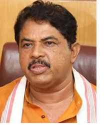
ಆರ್. ಅಶೋಕ್ ಪ್ರತಿಪಕ್ಷ ನಾಯಕರು