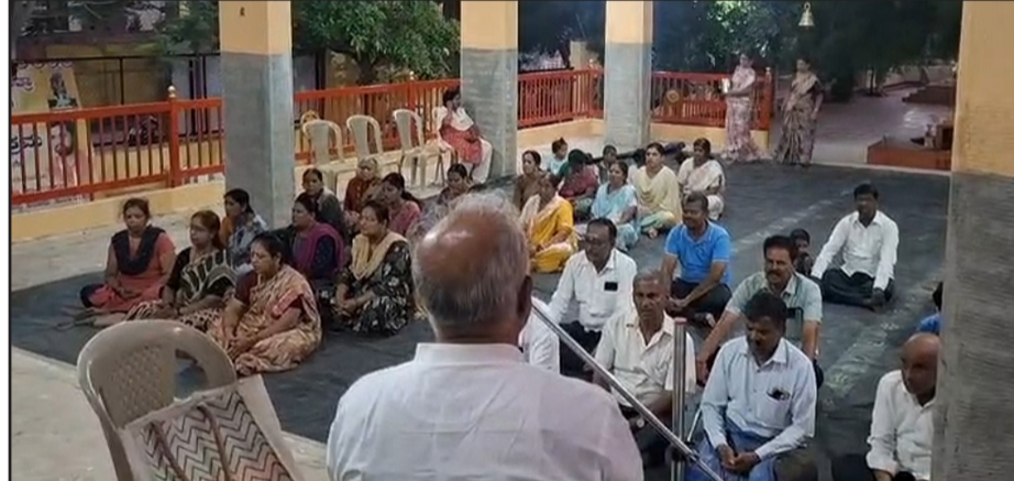
ಮುಕ್ತಿ ಪಡೆದು ಜೀವನದ ಕೊನೆಯ ಉಸಿರುಬಿಡುವವರೆಗೂ ಸಮನ್ವಯಿತ ಮತ್ತು ಸಮಷ್ಟಿಭಾವಗಳೆಂಬ ಪಂಚ ಸದಾ ಸಹಾಯ, ಸಹಕಾರ, ಸಮತಾಭಾವ, ಸದ್ಗುಣಗಳನ್ನು ಅನುಪಾಲಿಸಬೇಕು. ನಮ್ಮ ಬದುಕಿನ