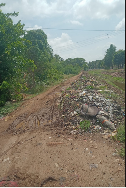
"ಹಲವು ಕಡೆ ಕೆನಾಲಿನ ಅಕ್ಕಿ ಪಕ್ಕದಲ್ಲಿರುವ ಗಿಡ ಗಂಟೆಗಳನ್ನು ಹಾಗೆ ಬಿಡಲಾಗಿದೆ ಅವುಗಳನ್ನು ಕೂಡಾ ತೆರವುಗೊಳಿಸಬೇಕು." ಹೆಸರು ಹೇಳಲಿಲ್ಲದ ಸ್ಥಳೀಯ ನಿವಾಸಿ.