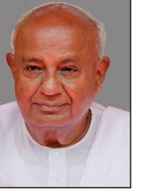
ಎಚ್.ಡಿ.ದೇವೇಗೌಡ ಮಾದಿ ಪ್ರಧಾನ ಮಂತ್ರಿ

"ಕಳೆದ ಹತ್ತು ವರ್ಷಗಳಲ್ಲಿ ಮೊದಲಿ ಅಪರೂಪದ ನನ್ನ ಸಂಬಂಧವು ಕೇವಲ ಒಂದು ರಾಜ್ಯಸಭೆ ಸ್ಥಾನಕ್ಕಾಗಿ ಬೆಳೆದದ್ದಲ್ಲ. ಅದು ನಮ್ಮಿಬ್ಬರ ನಡುವಿನ ಪ್ರಯತ್ನದ ಬಾಂಧವ್ಯವಾಗಿದೆ. ನಾನು ರಾಜ್ಯಸಭೆಯ ಸದಸ್ಯನಾಗಿರದಿದ್ದರೂ ಆ ಸಂಬಂಧ ಮುಂದುವರಿಯುತ್ತದೆ"