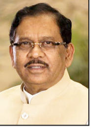
ಡಿ.ಶಿವಂ ಪರಮೇಶ್ವರ ಉಪ ಮುಖ್ಯಮಂತ್ರಿ

"2018ರಲ್ಲಿ ಕಾಂಗ್ರೆಸ್ 80 ಸ್ಥಾನ ಗೆದ್ದರೂ ಮೈತ್ರಿ ಸರ್ಕಾರದಲ್ಲಿ ಕುಮಾರಸ್ವಾಮಿ ಅವರು ಸಿಎಂ ಆದರು. ಅವತ್ತು ನನ್ನನ್ನೂ ಮುಖ್ಯಮಂತ್ರಿ ಮಾಡಬಹುದಿತ್ತು. ಆದರೆ ಅವಕಾಶ ಸಿಗಲಿಲ್ಲ. 2026ರಲ್ಲೂ ಸಿಎಂ ಹುದ್ದೆ ನಿರೀಕ್ಷೆ ಇತ್ತು. ಆದರೆ ರಾಜಕೀಯ ಕಾರಣಗಳಿಂದ ಸಾಧ್ಯವಾಗಲಿಲ್ಲ."