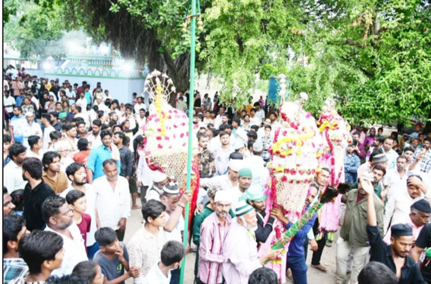
ಕಲಬುರಗಿ: ನಗರದ ಬೃಹದಾಚಾರ್ಯ ಹುಸೇನಿ ಚಿಲ್ಟಾ ದರ್ಗಾಡ್ ಹತ್ತಿರ ಮೊಹರಂ ಅಂಗವಾಗಿ ಇಂದು ಬೆಳಿಗ್ಗೆ ಆಲಂಗಳ ಮೆರವಣಿಗೆ ಜರುಗಿತು.ನೂರಾರು ಜನ ಭಾಗವಹಿಸಿದರು.