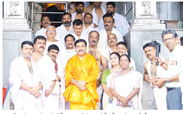
ರಾಜಕೀಯ ವಲಯದಲ್ಲಿ ಸಾಕಷ್ಟು ಚರ್ಚೆಗೆ ಕಾರಣವಾಗಿದೆ.

ಧರ್ಮಸ್ಥಳ: ಈ ಪವಿತ್ರ ಕ್ಷೇತ್ರದಲ್ಲಿ ನಿಂತು ಮಾತನಾಡುತ್ತಿದ್ದೇನೆ, ಮುಖ್ಯಮಂತ್ರಿ ಡಿ.ಕೆ.ಶಿವಕುಮಾರ್ ಅವರೊಂದಿಗೆ ಯಾವುದೇ ರೀತಿಯ ವ್ಯವಹಾರಿಕ, ಆತ್ಮೀಯತೆ ಇಲ್ಲ ಎಂದು ಬಿಜೆಪಿ ರಾಜ್ಯಾದ್ಯಕ್ಷ ಬಿ.ವೈ. ವಿಜಯೇಂದ್ರ ಅವರು ಶುಕ್ರವಾರ ಸ್ವಪ್ನನೆ ನೀಡಿದ್ದಾರೆ. ದೆಹಲಿ ಪ್ರವಾಸ ಮುಗಿಸಿ ಶುಕ್ರವಾರ ನೇರವಾಗಿ ಶ್ರೀ ಕ್ಷೇತ್ರ ಧರ್ಮಸ್ಥಳಕ್ಕೆ ಭೇಟಿ ನೀಡಿದ ಬಿ.ವೈ. ವಿಜಯೇಂದ್ರ ಅವರು, ಶ್ರೀ ಮಂಜುನಾಥ ಸ್ವಾಮಿಯ ದರ್ಶನ ಪಡೆದು ವಿಶೇಷ ಪೂಜೆ ಸಲ್ಲಿಸಿದರು. ಇತ್ತೀಚೆಗೆ ವಿಧಾನಪರಿಷತ್ ಚುನಾವಣೆಯಲ್ಲಿ ನಡೆದ ಅಡ್ಡಮತದಾನ ವಿವಾದದ ಬೆನ್ನಲ್ಲೇ ಅವರ ಈ ಭೇಟಿ ರಾಜಕೀಯ ವಲಯದಲ್ಲಿ ಸಾಕಷ್ಟು ಚರ್ಚೆಗೆ ಕಾರಣವಾಗಿದೆ.