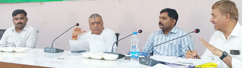
ಸಭೆ ನಡೆಸಿ ಗ್ರಾಮ ಅಡಳಿತ ಅಧಿಕಾರಿಗಳನ್ನು ಸಹ ಗ್ರಾಪಂ ಅಧಿಕಾರಿಗಳೊಂದಿಗೆ ಕೈ ಜೋಡಿಸಿ ವಾಸ್ತವವಾಗಿ ಎಲ್ಲಿ ಸಮಸ್ಯೆ ಇದೆ ಎಂಬುದನ್ನು ಕಂಡುಕೊಂಡು ಪ್ರತೀ ವಾರ ಸಭೆಗೆ ತಿಳಿಸಬೇಕೆಂದು ಶಾಸಕರು ಸೂಚಿಸಿದರು.