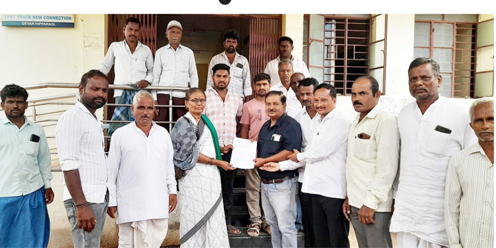
ಸಿಬ್ಬಂದಿಗೆ ಪೂರೈಕೆ ಮಾಡುವುದು ತಪ್ಪಿದಂತಾಗುತ್ತದೆ. ಒಂದು ವೇಳೆ ರೈತರ ಮನವಿಗೆ ಸ್ಪಂದಿಸದೇ ಸರಿಯಾಗಿ ವಿದ್ಯುತ್ ಪೂರೈಕೆ ಮಾಡದೇ ಇದ್ದಲ್ಲಿ ರೈತರು ಮುಂದಿನ ಹೋರಾಟಕ್ಕೆ ಇಳಿಯುವುದು ಅನಿವಾರ್ಯ ಎಂದು.