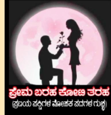
ಪ್ರೇಮ ಬರಹ ಕೋಟಿ ತರಹ (ಪ್ರಿಯ ಸಂಗೀತ ಮೋಹಕ ಸದರಗ ಗುಣ್ಣು)

ರಿಟ್ಟು ಉಸಿರುಗಟ್ಟಿಸಿದ್ದಳು. ಎದೆಯೊಳಗಿನ ತುಮುಲಗಳಿಗೆ ಸ್ಪಂದಿಸದೇ ಹೊರ ನಡೆದಿದ್ದಳು. ಆಕೆಯ ಸ್ನೇಹದಿಂದ ಒಳಗೊಳಗೇ ನೊಂದು ಬೆಂದು ಕುದ್ದು ಆಮಿಯಾಗಿ ಇಂಗಿದ ಕಂಬನಿಯ ಗೆರೆಗಳು ನನ್ನ ಮುಖದಲ್ಲಿ ಎದ್ದು ಕಾಣುತ್ತಿದ್ದವು. ಸ್ವಾರ್ಥಿಯಿಂದ ನಿರಾಪರಣೆ ಪ್ರೀತಿಯ