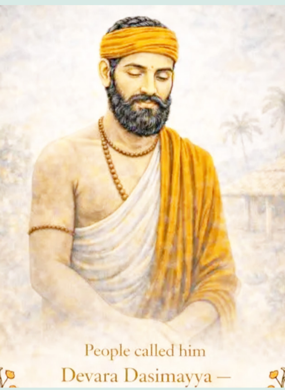
People called him Devara Dasimayya

ಹರಿಹರನ ಶಂಕರ ದಾಸಿಮಯ್ಯನ ರಗಳೆಯಲ್ಲಿ ಜೇಡರ ದಾಸಿಮಯ್ಯ ಮತ್ತು ದುರ್ಗೇಶಿಯರು ಸತಿ ಪತಿಯರಂದೇ ಉಲ್ಲೇಖ-ತರಾಗಿದ್ದಾರೆ. ಅವರಿಬ್ಬರೂ ಅತ್ಯಂತ ಸುಖಿಯು ಸಂಸಾರವಾಗಿತ್ತು. ದುರ್ಗೇಶಿ ತನ್ನ ವಚನಗಳಲ್ಲಿ ಬಸವ, ಚನ್ನಬಸವ, ಅಲ್ಲಮರನ್ನು ಸ್ತೋತ್ರ ಮಾಡಿದ್ದಾಳೆ ('ಭಕ್ತನಾದೆಡೆ ಬಸವಣ್ಣ ನಂತಾಗಬೇಕು. ಜಂಗಮನಾದರೆ ಪ್ರಭುದೇವರಂತಾಗಬೇಕು. ಭೋಗಿಯಾದೆಡೆ ಚನ್ನಬಸವಣ್ಣನಂತಾಗಬೇಕು') ಎಂದು ದುರ್ಗೇಶಿ, ಜೇಡರ ದಾಸಿಮಯ್ಯನ ಬಸವಣ್ಣ ಅಲ್ಲಮ ಇವರ ಸಮಕಾಲೀನರು; ಅವರ ಕಾಲ ಸ್ಪಷ್ಟವಾಗಿ ಕ್ರಿ.ಶ. 1160: ಬಸವಣ್ಣ ಆ ಕಾಲದಲ್ಲಿ ಆಳಿದ ಬಿಜ್ಜಳನ ಭಂಡಾರಿ.