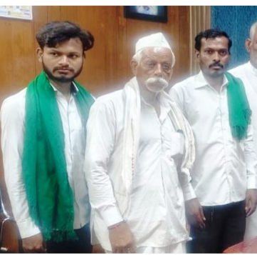
ಇದರಿಂದ ಉತ್ಪಾಕ ಗ್ರಾಮಕ್ಕೆ ನೇರವಾಗಿ ಅನುಕೂಲವಾಗುತ್ತದೆ. ಒಂದು ವೇಳೆ ಸಂಗಮೇಶ ಆಸ್ಪತ್ರೆ ನೇರದಲ್ಲಿ ಅಂಡರ್ ಪಾಸ್ ಮಾಡದಿದ್ದಲ್ಲಿ ಎತ್ತಿನ ಗಾಡಿ ಹಾಗೂ ಟ್ರಾಕ್ಟರ್ ಗಳನ್ನು ಹಿಟ್ಟುಳ್ಳ ಟೋಲ ಸಮೀಪ ಹೋಗಿ ಮರಳಿ ಇತ್ತ ಕಡೆ ಬರಬೇಕಾಗುತ್ತದೆ. ಇದರಿಂದ ಟ್ರಾಪಿಕ್ ಸಮಸ್ಯೆ ಆಗುವುದರ ಜೊತೆಗೆ ಅಪಘಾತ ಕೂಡಾ ಸಂಭವವಿದೆ. ಆದ್ದರಿಂದ ಮಾನ್ಯ ಸಂಸದರು ಈ ಬಗ್ಗೆ ವಿಶೇಷ ಗಮನ ಹರಿಸಿ

ವಿಜಯಪುರ: ನಗರದ ಹೊರವಲಯದ ಬೆಂಗಳೂರ ಬೈಪಾಸ್‌ನಲ್ಲಿ ವಾಹನ ದಟ್ಟಣೆ ಹೆಚ್ಚಾಗಿ ಅಪಘಾತಗಳು ಸಂಭವಿಸುತ್ತಿರುವುದರಿಂದ ಅಲ್ಲೂರು ಓವರ್ ಬ್ರಿಡ್ಜ್ ಮಾಡಬೇಕೆಂದು ಹಲವಾರು ಮನವಿಯನ್ನು ಜಿಲ್ಲಾಧಿಕಾರಿಗಳ ಮೂಲಕ ಸಂಬಂಧಿಸಿದ ಅಧಿಕಾರಿಗಳಿಗೆ ಹಾಗೂ ಸಂಸದರಾದ ರಮೇಶ ಜಿಗಜೀಗಿ ಅವರಿಗೆ ಮನವಿ ಸಲ್ಲಿಸಲಾಗಿತ್ತು. ಅದರ ಪ್ರತಿಫಲವಾಗಿ ಇಂದು ಓವರ್ ಬ್ರಿಡ್ಜ್ ಮಾಡಲಾಗುತ್ತಿದೆ. ಈ ಓವರ್ ಬ್ರಿಡ್ಜ್ ಕೆಳಗೆ ಅಂಡರ್ ಪಾಸ್ ಮಾಡಬೇಕೆಂದು ಕರ್ನಾಟಕ ರಾಜ್ಯ ರೈತ ಸಂಘ ಹಾಗೂ ಹಸಿರು ಸೇನೆ ಪದಾಧಿಕಾರಿಗಳು ನಗರದ ಸಂಸದರಾದ ರಮೇಶ ಜಿಗಜೀಗಿ ಅವರಿಗೆ ಮನವಿ ಸಲ್ಲಿಸಿದರು.