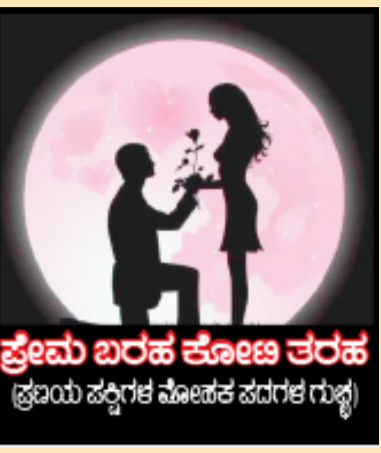
ಪ್ರೇಮ ಬರಹ ಕೋಣ ತರಹ (ಪ್ರಥಮ ಪಠ್ಯಗಳ ಮೋಹಕ ಪದಗಳ ಗುಚ್ಛ)

ಉಸುರುವುದು. ಒಂದೇ ಮಾತಿನಲ್ಲಿ ಹೇಳಬೇಕೆಂದರೆ ಹೃದಯಗಳನ್ನು ಬೆಸೆಯುವ ಒಂದು ಅದ್ಭುತ ಶಕ್ತಿ. ಕಷ್ಟಗಳು ತುಂಬಿದ ಕಡಲಿನ ಬದುಕನ್ನು ದಡೆ ಸೇರಿಸುವ ಸುಖದ ತಾಯಿದೋಲೆ. ಪ್ರೀತಿ ತೀರಾ ಸುಲಭದ ಮಾತಲ್ಲ. ಅದನ್ನು ತೀರಾ ಹಗುರವಾಗಿ ತೆಗೆದುಕೊಂಡರೆ ಜೀವನದ ಕಥೆ ಮುಗಿದೇ ಹೋಯಿತು ಎಂದರ್ಥ. ಎಲ್ಲವೂ ಬದಲಾಗುತ್ತದೆ ಎಲ್ಲರೂ ಕಾದಿದೆ. ಮನದ ಅಂತಃಪುರದ ಕನಸಿನ ಎಳಕಾದ ಎಸಳುಗಳ ನಿನಗಾಗಿ ಕಾಯುತ್ತಿವೆ ಪ್ರಾಣ ಸಖಿ.