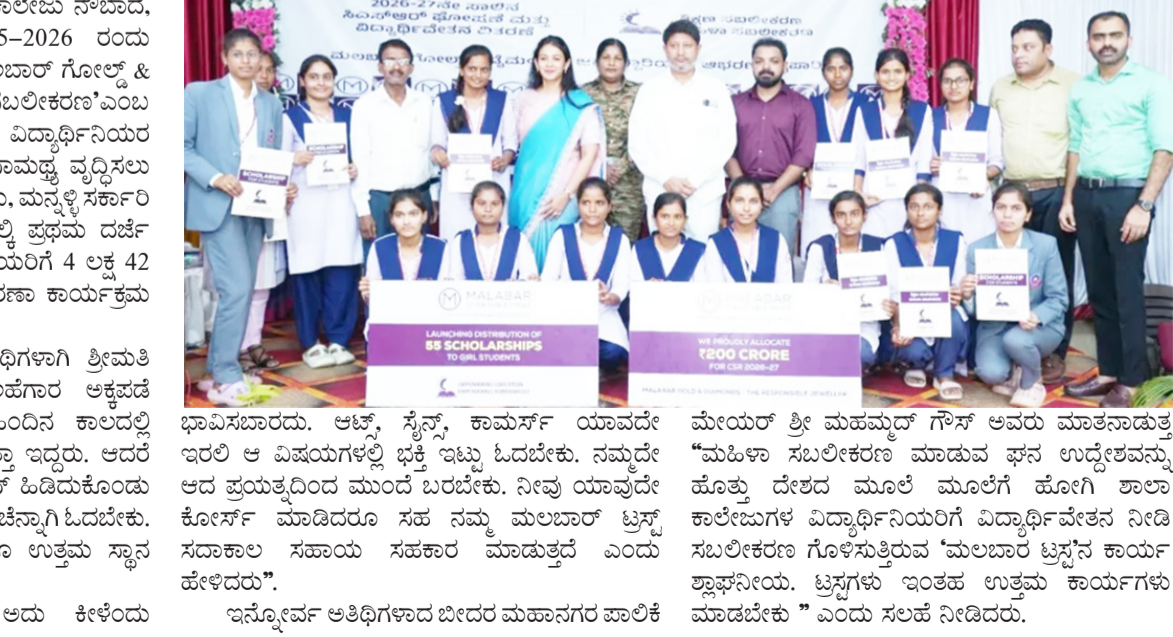
ಭಾವಿಸಬಾರದು. ಆಟ್ಸ್ ಸೈನ್ಸ್, ಕಾಮರ್ಸ್ ಯಾವುದೇ ಇರಲಿ ಆ ವಿಷಯಗಳಲ್ಲಿ ಭಕ್ತಿ ಇಟ್ಟು ಓದಬೇಕು. ನಮ್ಮದೇ ಆದ ಪ್ರಯತ್ನದಿಂದ ಮುಂದೆ ಬರಬೇಕು. ನೀವು ಯಾವುದೇ ಕೋರ್ಸ್ ಮಾಡಿದರೂ ಸಹ ನಮ್ಮ ಮಲಬಾರ್ ಟ್ರಸ್ಟ್ ಸದಾಕಾಲ ಸಹಾಯ ಸಹಕಾರ ಮಾಡುತ್ತದೆ ಎಂದು ಹೇಳಿದರು. ಇನ್ನೂರ್ವ ಅತಿಥಿಗಳಾದ ಬೀದರ ಮಹಾನಗರ ಪಾಲಿಕೆ