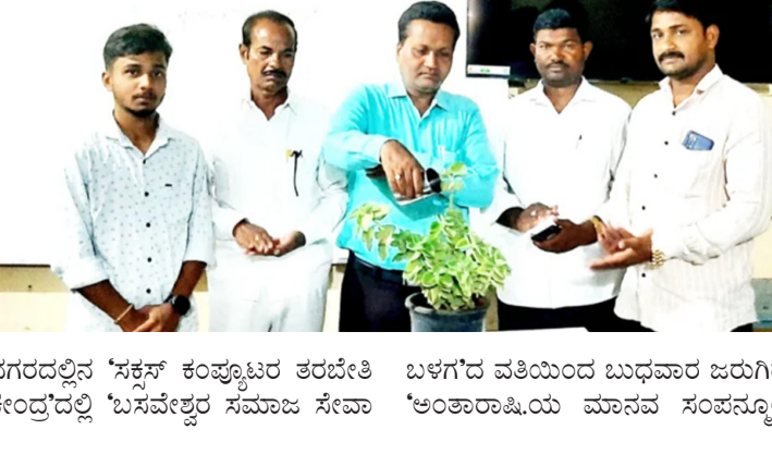
ನಗರದಲ್ಲಿನ 'ಸಕ್ಸಸ್' ಕಂಪ್ಯೂಟರ್ ತರಬೇತಿ ಕೇಂದ್ರದಲ್ಲಿ 'ಬಸವೇಶ್ವರ ಸಮಾಜ ಸೇವಾ ಬಳಗ'ದ ವತಿಯಿಂದ ಬುಧವಾರ ಜರುಗಿದ 'ಅಂತಾರಾಷ್ಟ್ರೀಯ ಮಾನವ ಸಂಪನ್ಮೂಲ