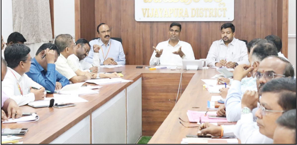
ಶಿಥಿಲಾವಸ್ಥೆಯಲ್ಲಿರುವ ಮನೆಗಳು, ಶಾಲೆಗಳು, ಅಂಗನವಾಡಿ, ಅಧಿಕಾರಿಗಳನ್ನೇ ಹೊಣೆಗಾರರನ್ನಾಗಿ ಮಾಡಲಾಗುವುದು ಎಂದು

ನಗರದ ಜಿಲ್ಲಾಧಿಕಾರಿಗಳ ಕಚೇರಿಯ ಕೆಪ್ಪಾ ಸಭಾಂಗಣದಲ್ಲಿ ಶುಕ್ರವಾರ ನಡೆದ ಜಿಲ್ಲಾ ವಿಪತ್ತು ನಿರ್ವಹಣಾ ಪ್ರಾಧಿಕಾರದ ಪೂರ್ವಸಿದ್ಧತೆ ಸಭೆಯ ಅಧ್ಯಕ್ಷತೆ ವಹಿಸಿ ಅವರು ಮಾತನಾಡಿದರು. ಮಳೆಗಾಲದಲ್ಲಿ ಜನ-ಜಾನುವಾರುಗಳ ಹಾನಿ ತಪ್ಪಿಸಲು ಎಲ್ಲ ಅಧಿಕಾರಿಗಳು ಮುಂಜಾಗತಾ ಕ್ರಮಗಳನ್ನು ಕಟ್ಟುನಿಟ್ಟಾಗಿ ಕೈಗೊಳ್ಳಬೇಕು ಎಂದು ಸೂಚಿಸಿದರು. ತಾಲೂಕು ಮಟ್ಟದಲ್ಲಿ 24x7 ಹೆಲ್ಪ್‌ಲೈನ್ ಸ್ಥಾಪಿಸಿ, ತುರ್ತು ಸಂದರ್ಭದಲ್ಲಿ ತಹಶೀಲ್ದಾರರು ಸ್ಥಳದಲ್ಲೇ ಇದ್ದು ಸಾರ್ವಜನಿಕರ ಸಮಸ್ಯೆಗೆ ತಕ್ಷಣ ಸ್ಪಂದಿಸಬೇಕು ಎಂದರು. ಪ್ರವಾಹ, ಕಲುಷಿತ ನೀರು, ಸ್ಥಳಾಂತರ ಸೇರಿದಂತೆ ಯಾವುದೇ ಸಮಸ್ಯೆ ಎದುರಾದ ಕೂಡಲೇ ಕಂಟ್ರೋಲ್ ರೂಂ ಮೂಲಕ ಕ್ರಮ ಕೈಗೊಳ್ಳುವಂತೆ ಸೂಚಿಸಿದರು. ಕೃಷ್ಣಾ, ಭೀಮಾ ಹಾಗೂ ದೋಣಿ ನದಿಗಳ ಪ್ರವಾಹ ಪರಿಸ್ಥಿತಿಯನ್ನು ನಿರಂತರವಾಗಿ ಗಮನಿಸಿ, ಜಲಾಶಯಗಳ ನೀರಿನ ಮಟ್ಟದ ಮಾಹಿತಿ