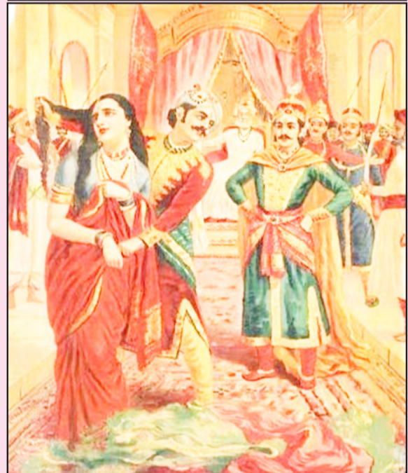
ಇತ್ತ ಸೊಸೆ ಪಾಂಚಾಲಿ ಜೀವನವೆಲ್ಲಾ ನೋವನ್ನೇ ಉಣ್ಣುತ್ತಾಹೋದಳು