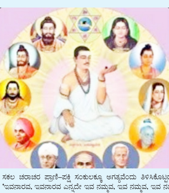
ಸಕಲ ಚಾರಾಚರ ಪ್ರಾಣಿ-ಪಕ್ಷಿ ಸಂಕುಲಕ್ಕೂ ಅಗತ್ಯವೆಂದು ತಿಳಿಸಿಕೊಟ್ಟರು. "ಇವನಾರವ, ಇವನಾರವ ಎನ್ನದೇ ಇವ ನಮ್ಮವ, ಇವ ನಮ್ಮವ, ಇವ ನಮ್ಮವ"