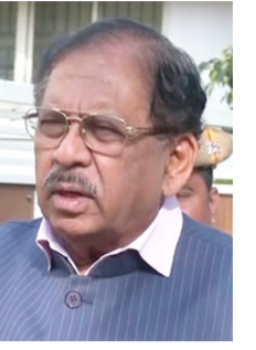
ಡಾ.ಜಿ.ವರಮೇಶ್ವರ ಗೃಹ ಸಚಿವರು

"ಮುಸ್ಲಿಮರು ಕಾಂಗ್ರೆಸ್ ಪಕ್ಷದ ಬೆನ್ನಿಗೆ ನಿಂತಿದ್ದಾರೆ. ನಾವು, ಮುಸ್ಲಿಮರು ಯಾವತ್ತೂ ಸಹೋದರರಿದ್ದಂತೆ. ಹೀಗಾಗಿ ಕಾಂಗ್ರೆಸ್ ಅಲ್ಪಸಂಖ್ಯಾತರನ್ನು ನಿರ್ಲಕ್ಷ್ಯ ಮಾಡಿಲ್ಲ ಮತ್ತು ಅವರನ್ನು ಗುರಿಯಾಗಿರುವ ಪ್ರಶ್ನೆಯೇ ಇಲ್ಲ"