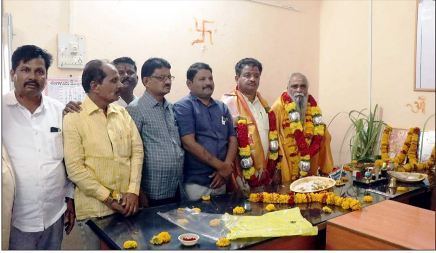
■ ಉದಯರಶ್ಮಿ ದಿನಪತ್ರಕ್ಕೆ