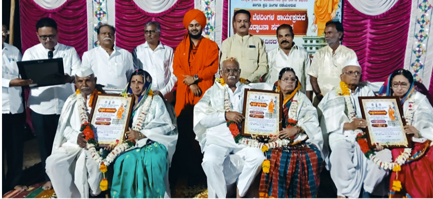
■ ಉದಯರಶ್ಮಿ ದಿನಪತ್ರಕ್ಕೆ