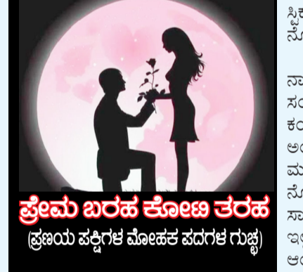
ಪ್ರೇಮ ಬರಹ ಕೋಣ ತರಹ (ಪ್ರಣಯ ಪಕ್ಷಿಗಳ ಮೋಹಕ ಪದಗಳ ಗುಚ್ಛ)

ನನಪುಗಳ ಓಣಿಯಲ್ಲಿ ಓಡಾಡುತ್ತಿರುವ ನನಪುಗಳ ಮಳಿಗೆಯಲಿ ಇನ್ನಾರಿಲ್ಲ ನಿನ್ನ ಹೊರತು. ನೀನಿಲ್ಲದೇ ನನಪಿನ ಆ ಓಣಿ ಕೆಳಗಿಳಿಬಿಟ್ಟುಬಿಟ್ಟಿರಬೇಕೆ? ನೀನೊಂದಿದ್ದ ದಿನಗಳೇ ಅಪ್ಪಟ ಸ್ವರ್ಗದ ದಿನಗಳು. ಸ್ವರ್ಗವೊಂದು ಏನಾದರೂ ಭೂಮಿಯ ಮೇಲಿದ್ದರೆ ಅದು ನೀನೊಂದಿದ್ದಾಗ ಮಾತ್ರ ಗೋಚರಿಸುತ್ತದೆ. ಸ್ವರ್ಗ ಬೇರಲ್ಲ ನೀನು ಬೇರಲ್ಲ ಅಂತ ಎಷ್ಟೊಂದು ಸಲ ನನಗೆ ಅನಿರ್ದಿಷ್ಟ ಸುಖವನ್ನು ನೀಡಿದ್ದೆ. ಪ್ರಾಣ ಸ್ನೇಹಿತೆಯಾದ ನಿನ್ನ ಬಗ್ಗೆನ ವಿಚಾರಗಳೆಲ್ಲ ಗಾಣದಂತೆ ಸದಾ ಸುತ್ತುತ್ತಲೇ ಇರುತ್ತವೆ. ಬಾಲ್ಯದಲ್ಲಿ ಗಂಡ ಹೆಂಡತಿಯಾಗಿ ಆಡಿದ ಆಟವಂತೂ ಇಂಚಿಂಚಾಗಿ ಯಥಾವತ್ತಾಗಿ ನನಪಿನಲ್ಲಿಟ್ಟಿದೆ ಮೆದುಳು. ಗಂಡ ಹೆಂಡತಿಯಾಟ ನನಪಿನ ಶಾಲೆಯಲ್ಲಿ ಹೆಚ್ಚಿಷ್ಟು ತೆರದುಕೊಳ್ಳುತ್ತದೆ. ಅದೇ ಈಗ ನಿಜವಾದರೆ ನನ್ನನ್ನು ಹಿಡಿಯುವವರೇ ಇಲ್ಲ. ಹೀಗೆ ನನಪಿನ ಲೋಕದಲ್ಲಿ ವಿಹರಿಸುವ ಹುಚ್ಚು ಇತ್ತೀಚೆಗೆ ಮತ್ತಷ್ಟು ಹೆಚ್ಚಿತ್ತಿದೆ. ನೀನಿಲ್ಲದೇ ಪ್ರೇಮ ಲೋಕದ ಪ್ರಪಂಚ ನಿಂತಂತಾಗಿದೆ. ಮನಸ್ಸು ಕೂಡ ಭಾರವಾಗುತ್ತಿದೆ. ನನ್ನ ಅಪ್ರತಿಮ ಅನುಪಮ ಪ್ರೇಯಸಿ ಜೊತೆ ಭಾವನೆಗಳ ಬೆಸೆಯಲು ಮನಸ್ಸು ತಾತೊರೆಯುತ್ತಿದೆ. ನಿನ್ನ ಚಂದದ