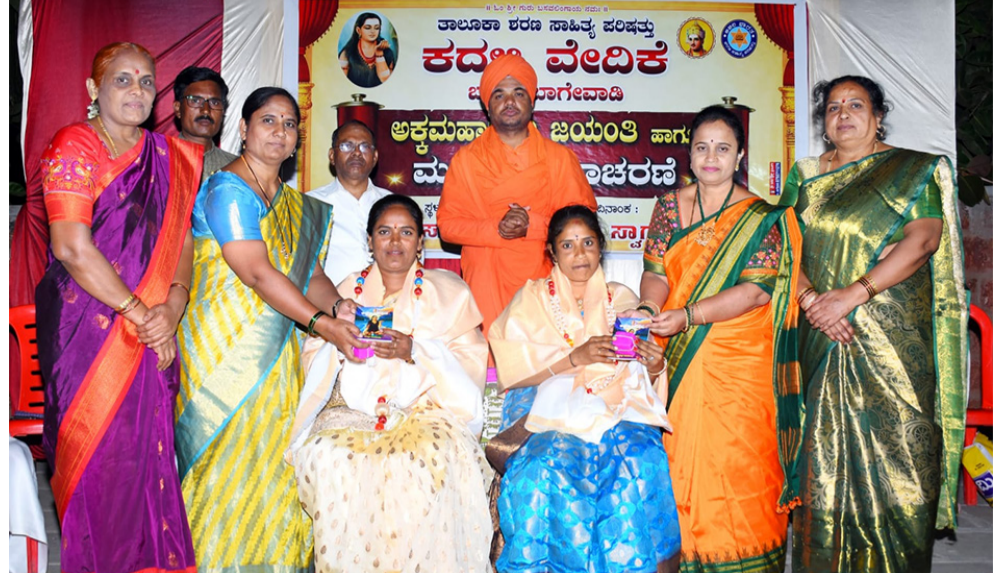
ಎಲ್ಲ ಮಹಿಳೆಯರು ಉತ್ತಮ ನಡೆ-ನುಡಿಯಿಂದ ಜೀವನ ಸಾಗಿಸುವಂತಾಗಬೇಕೆಂದರು.