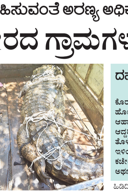
ಹಿಡಿದು ಹಗ್ಗದಿಂದ ಬಂಧಿಸಿ ವಾಹನದಲ್ಲಿ ಹಾಕಿಕೊಂಡು ಅಧೀನಿ ಪ್ರಾದೇಶಿಕ ಅರಣ್ಯ ಇಲಾಖೆಗೆ ಒಪ್ಪಿಸಿದ್ದಾರೆ. ಶಿರಹಟ್ಟಿ ಗ್ರಾಮಸ್ಥರು ಒಗ್ಗಟ್ಟಿನಿಂದ