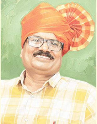
ಸರಳತೆ ಮತ್ತು ಸಂವಹನ ವಚನಗಳು ಜನಸಾಮಾನ್ಯರ ಆಡುಭಾಷೆಯಲ್ಲಿ ಅತಿ ಕ್ಲಿಷ್ಟವಾದ ತತ್ವಗಳನ್ನು ಸರಳವಾಗಿ ತಿಳಿಸಿದವು. ಒಬ್ಬ ಉತ್ತಮ ಸಂಪಾದಕ ಕೂಡ ಕ್ಲಿಷ್ಟಕರವಾದ ವಿಷಯಗಳನ್ನು ಓದುಗರಿಗೆ ಸುಲಭವಾಗಿ ಅರ್ಥವಾಗುವಂತೆ ರೂಪಿಸಬೇಕು. ಪಾಂಡಿತ್ಯ ಪ್ರದರ್ಶನಕ್ಕಿಂತ ಜನಸಾಮಾನ್ಯರಿಗೆ ತಲುಪುವ 'ಸರಳತೆ' ಇಲ್ಲಿ ಮುಖ್ಯವಾಗುತ್ತದೆ. ಸಮಾಜದ ತತ್ವಗಳನ್ನು ತಿದ್ದುವ ಜವಾಬ್ದಾರಿ "ಲೋಕದ ಡೊಂಕ ನೀವೇಕೆ ತಿದ್ದುವಿರಿ, ನಿಮ್ಮ ನಿಮ್ಮ ತನುವ ತಿದ್ದಿಕೊಳ್ಳಿ" ಎನ್ನುವ ವಚನದಂತೆ, ಸಂಪಾದಕರು ಮೊದಲು ತಾವು ಮನಗಂಡವರು ಮತ್ತು ಜವಾಬ್ದಾರಿಯುತರಾಗಿದ್ದು, ನಂತರ ಸಮಾಜದ ತತ್ವಗಳನ್ನು ನಿರ್ಭಯವಾಗಿ ಎತ್ತಿ ತೋರಿಸಬೇಕು. ಸಮಾಜದ ಅಂಕುಡೊಂಕಗಳನ್ನು ತಿದ್ದುವಾಗ ಯಾವುದೇ ಪ್ರಭಾವಕ್ಕೂ ಒಳಗಾಗದಿರುವುದು ಬಸವ ಪಥದ ಹಾದಿಯಾಗಿದೆ.