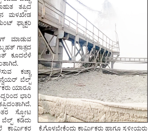
ಕೈಗೊಳ್ಳಬೇಕೆಂದು ಕಾರ್ಮಿಕರು ಹಾಗೂ ಸ್ಥಳೀಯರು ಒತ್ತಾಯಿಸಿದ್ದಾರೆ.

ಕಲಬುರಗಿ: ಕಾರ್ಮಿಕರು ಯಾರೂ ಇಲ್ಲದ ವೇಳೆಬೃಹತ್ ಗಾತ್ರದ ಕನ್ವಿಯರ್ ಬೆಲ್ಟ್ ಕಡಿದು ಬಿದ್ದು ಸಂಭವಿಸಬಹುದಾಗಿದ್ದ ಭಾರಿ ಅನಾಹುತ ತಪ್ಪಿದ ಘಟನೆಯೊಂದು ಸೇಡಂ ತಾಲೂಕಿನ ಮಳಬೇಡ ಸಮೀಪದ ಅಲ್ಪಾಟೆ ರಾಜಪ್ರೀ ಸಿಮೆಂಟ್ ಫ್ಯಾಕ್ಟರಿ ಆವರಣದಲ್ಲಿ ಸಂಭವಿಸಿದೆ. ಸಿಮೆಂಟ್ ಚೀಲಗಳನ್ನು ಪ್ಯಾಕಿಂಗ್ ಮಾಡುವ ಸ್ಥಳದಲ್ಲಿ ಯಾರೂ ಇಲ್ಲದ ಹೊತ್ತಿನಲ್ಲಿ ಬೃಹತ್ ಗಾತ್ರದ ಬೆಲ್ಟ್ ಕಡಿದು ಬಿದ್ದಿದೆ. ಅದ್ಭುತವಾಗಿತ್ತು ಕೂಡಲೆಗೆ ಅಂತರದಲ್ಲಿ ಭಾರಿ ಅನಾಹುತ ತಪ್ಪಿದಂತಾಗಿದೆ. ಸಿಮೆಂಟ್ ತಯಾರಿಕೆಗೆ ಬಳಸುವ ಕೆಚ್ಚಾ ವಸ್ತುಗಳನ್ನು ಸಾಗಿಸಲು ಬಳಸುವ ಕನ್ವಿಯರ್ ಬೆಲ್ಟ್ ಅಡಿಯಲ್ಲಿ ಕೆಲಸ ಮಾಡುತ್ತಿದ್ದ ಕಾರ್ಮಿಕರು ಯಾರೂ ಇಲ್ಲದ ವೇಳೆ ಈ ದುರಂತ ಸಂಭವಿಸಿದ್ದರಿಂದ ಭಾರಿ ಪ್ರಮಾಣದ ಪ್ರಾಣಾಪಾಯ ತಪ್ಪಿದಂತಾಗಿದೆ. ಕಾರ್ಖಾನೆಯ ಸುತ್ತುವರಿದು ನಿಂತಂತ ಸೋಂಟ ಪ್ರಕ್ರಿಯೆ ಕೈಗೊಳ್ಳುವುದರಿಂದ ಹೀಗೆ ಬೆಲ್ಟ್ ಕಡಿದು ಬಿದ್ದಿರುವ ಸಾಧ್ಯತೆಯಿದ್ದು, ಕೂಡಲೆ ಕಾರ್ಮಿಕರ ಸುರಕ್ಷತೆಗೆ ಅಗತ್ಯ ಪೂರಕ ಕ್ರಮಗಳನ್ನು