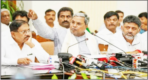
ತೀರ್ಪು ಮರುಪರಿಶೀಲಿಸಲು ಸುಪ್ರೀಂ ಕೋರ್ಟ್ ನಕಾರ

ಬೆಂಗಳೂರು: ಪರಿಶಿಷ್ಟ ಜಾತಿ (ಎಸ್.ಸಿ.)ಗಳಿಗೆ ಒಳಮೀಸಲಾತಿ ಜಾರಿಗೊಳಿಸಲು ಮತ್ತು ಈ ಸಂಬಂಧ ಹೈಕೋರ್ಟ್ ನಿವೃತ್ತ ನ್ಯಾಯಮೂರ್ತಿಗಳ ನೇತೃತ್ವದಲ್ಲಿ ಆಯೋಗ ರಚಿಸಲು ಸೋಮವಾರ ನಡೆದ ಸಚಿವ ಸಂಪುಟ ಸಭೆ ಒಪ್ಪಿಗೆ ನೀಡಿದೆ. ಸೋಮವಾರ ಮುಖ್ಯಮಂತ್ರಿ ಸಿದ್ದರಾಮಯ್ಯ ನೇತೃತ್ವದಲ್ಲಿ ನಡೆದ ಸಚಿವ ಸಂಪುಟ ಸಭೆಯ ಬಳಿಕ ಸುದ್ದಿಗೋಷ್ಠಿ ಉದ್ಘಾಟಿಸಿ ಮಾತನಾಡಿದ ಕಾನೂನು ಮತ್ತು ಸಂಸದೀಯ ವ್ಯವಹಾರಗಳ ಸಚಿವ ಎಚ್.ಕೆ. ಪಾಟೀಲ್ ಅವರು, ಒಳ ಮೀಸಲಾತಿ ಜಾರಿ ಸಂಬಂಧ ಹೈಕೋರ್ಟ್ ನಿವೃತ್ತ ನ್ಯಾಯಮೂರ್ತಿಗಳ ನೇತೃತ್ವದಲ್ಲಿ ಆಯೋಗ ರಚಿಸಲಾಗುವುದು ಎಂದರು. ಎಸ್.ಸಿ.ಗಳಿಗೆ ಒಳ ಮೀಸಲಾತಿ ಜಾರಿ ಮಾಡುವ ನಿಟ್ಟಿನಲ್ಲಿ ನಂಬಲಾರ್ಹ ದಾಖಲೆಗಳು ಹಾಗೂ ದತ್ತಾಂಶ ಸಂಗ್ರಹಿಸಲು ನಿವೃತ್ತ ನ್ಯಾಯಮೂರ್ತಿಗಳ ನೇತೃತ್ವದಲ್ಲಿ ಆಯೋಗ ರಚನೆ ಮಾಡಲು ನಿರ್ಧಾರ ಮಾಡಲಾಗಿದೆ. ಮೂರು ತಿಂಗಳಲ್ಲಿ ಆಯೋಗ ವರದಿ ನೀಡಲಿದೆ ಎಂದರು.