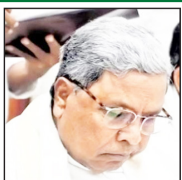
ಮುಡಾ ಅಧ್ಯಕ್ಷರು ರಾಜೀನಾಮೆ ನೀಡಿದ್ದಾರೆ. ನಿಮ್ಮಲ್ಲಿ ಕಿಂಚಿತ್ತೂ ನೈತಿಕತೆ ಉಳಿದಿದ್ದರೆ ಕೂಡಲೇ ಅಧಿಕಾರದಿಂದ

ಇಡಿ ಯಿಂದ ತನಿಖೆ ಸಿದ್ದರಾಮಯ್ಯ ಅವರ ಪತ್ನಿಗೆ ಮುಡಾದಿಂದ 14 ನಿವೇಶನ ಹಂಚಿಕೆಯಲ್ಲಿ ನಡೆದಿರುವ ಅಕ್ರಮಗಳ ಕುರಿತು ಲೋಕಾಯುಕ್ತ ಮತ್ತು ಜಾಲಿ ನಿರ್ದೇಶನಾಲಯದ ತನಿಖೆ ನಡೆಯುತ್ತಿರುವುದನ್ನು ಇಲ್ಲಿ ಸ್ಮರಿಸಬಹುದು.