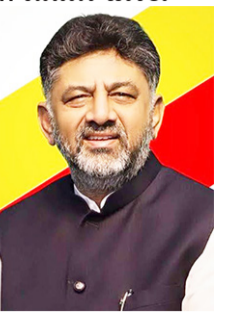
ಡಿ.ಕೆ.ಶಿವಚಾರ್ಯ ಉಪ ಮುಖ್ಯಮಂತ್ರಿ

"ಬೆಂಗಳೂರಿನಲ್ಲಿ ಅನಿರೀಕ್ಷಿತವಾಗಿ ಸುರಿಯುತ್ತಿರುವ ಭಾರಿ ಮಳೆಯನ್ನು ನಿಭಾಯಿಸಲು ಸರ್ಕಾರ ಸಮರ್ಥನನಾಗಿದೆ. ಪ್ರಕೃತಿಗೆ ಕಡಿವಾಣ ಹಾಕಲು ಸಾಧ್ಯವೇ? ಚಂಡಮಾರುತ ತಡೆಯಲು ಸಾಧ್ಯವೇ? ಇದನ್ನು ಅರ್ಥ ಮಾಡಿಕೊಳ್ಳುವ ವಿರೋಧ ಪಕ್ಷಗಳು ರಾಜ್ಯದ ಮಾನ ಹರಾಜು ಹಾಕುವುದನ್ನು ನಿಲ್ಲಿಸಬೇಕು."