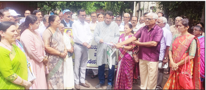
ಅಭಿವೃದ್ಧಿಗೆ ಕಳಂಕ ತರುವ ಈ ಕೃತಿಯನ್ನು ಕೂಡಲೇ ಸರ್ಕಾರ ಮುಟ್ಟುಗೋಲು ಹಾಕಬೇಕು. ಅಲ್ಲದೇ 'ಶರಣ ಶಕ್ತಿ' ಎಂಬ ಚಲನಚಿತ್ರವು ಶರಣರ ಚರಿತ್ರೆಗೆ ಮಸಿ ಬಳಿಯುವ ರೀತಿಯಲ್ಲಿ ಶರಣ-ರ ಬದುಕನ್ನು ಕ್ರೌರ್ಯದಿಂದ, ಅನಾಗರಿಕ ಸಂಭಾಷಣೆಯಿಂದ ಚಿತ್ರಿಸಿ ಶರಣ ಸಂಸ್ಕೃತಿಗೆ ಅಪಮಾನ ಮಾಡಿದ್ದಾರೆ. ಈ ಚಲನಚಿತ್ರದ ಅನೇಕ ಸನ್ನಿವೇಶಗಳು ಸಾಮಾಜಿಕ ಜಾಲತಾಣಗಳಲ್ಲಿ ಹರಿದಾಡುತ್ತಿದ್ದು, ಅದನ್ನು ಕೂಡಲೇ ತೆಗೆಸಿ, 'ಶರಣ ಶಕ್ತಿ' ಚಲನಚಿತ್ರ ಪ್ರದರ್ಶನಕ್ಕೆ ಸರ್ಕಾರ ತಕ್ಷಣ ನಿಷೇಧ ಹೇರಬೇಕೆಂದು ಆಗ್ರಹಿಸಿದರು.