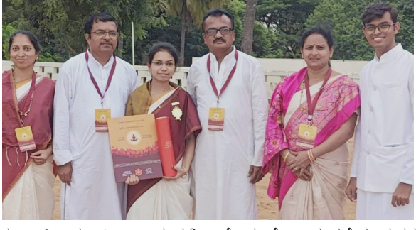
ಕಲಬುರಗಿಯ ವಿಧ್ಯಾಲಯದಲ್ಲಿ ಅಧ್ಯಯನ ಮಾಡಿದ ಇವಳು ಅಧ್ಯಯನ ಕೇಂದ್ರಕ್ಕೆ ಪ್ರಥಮ ಸ್ಥಾನ ಹಾಗೂ ಇಡೀ ವಿಶ್ವವಿದ್ಯಾಲಯಕ್ಕೆ ಮೊದಲನೇ ಸ್ಥಾನ ಪಡೆಯುವುದರ ಮೂಲಕ ಇತಿಹಾಸ ವಿಷಯದಲ್ಲಿ ಜಿನ್ನದ ಪದಕ ಪಡೆದುಕೊಂಡಿದ್ದಾಳೆ ಶ್ರೀ ಸತ್ಯ ಸಾಯಿ ಮಾನವ