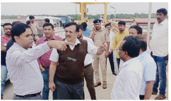
ಜನವಸತಿ ಪ್ರದೇಶಕ್ಕೆ ನೀರು ಹೊಕ್ಕರೆ, ಕಾಳಜಿ ಕೇಂದ್ರ ತೆರೆಯಲು ಶಾಲೆ, ಸಮುದಾಯ ಭವನವನ್ನು ಗುರುತಿಸಲಾಗಿದೆ. ಗ್ರಾಮ ಆಡಳಿತಾಧಿಕಾರಿಯ ಮೂಲಕ ಗ್ರಾಮಗಳಲ್ಲಿ ಡಂಗುರ ಸಾರಿಸಲಾಗಿದ್ದು, ನಿರಂತರ ಮುನ್ನೂಚನೆ ನೀಡಲಾಗುತ್ತದೆ. ಮುನ್ನೂಚನೆಗೆ ಜನ ಸ್ಪಂದಿಸಬೇಕು