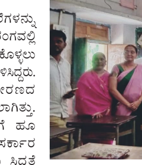
ಕಳೆದ ವಿದ್ಯಾರ್ಥಿಗಳು ಉತ್ಸಾಹದಿಂದ ಶಾಲೆಗೆ ಹೋಗಲು ಸಿದ್ಧವಾಗುತ್ತಿದ್ದಾರೆ.

ಕಳೆದ ರೆಡು ದಿನಗಳಿಂದ ಶಾಲೆಗಳನ್ನು ಸ್ವಚ್ಛಗೊಳಿಸಿ ತಳುಕು-ತೋರಣ, ರಂಗವಲ್ಲಿ ಚಿತ್ರಾರ ಬಿಡಿಸಿ ಮಕ್ಕಳನ್ನು ಸ್ವಾಗತಿಸಿಕೊಳ್ಳಲು ಶಾಲೆಗಳನ್ನು ಶಿಕ್ಷಕ ಬಾಂಧವರು ಸಜ್ಜುಗೊಳಿಸಿದ್ದರು. ಕೆಲ ಶಾಲೆಗಳಲ್ಲಿ ತಳುಕು-ತೋರಣದ ಜೊತೆಗೆ ಬಲನುಗುಳನ್ನು ಕಟ್ಟಲಾಗಿತ್ತು. ಕೆಲ ಶಾಲೆಗಳಲ್ಲಿ ವಿದ್ಯಾರ್ಥಿಗಳಿಗೆ ಹೂ ನೀಡಿ ಸ್ವಾಗತಿಸಿಕೊಳ್ಳಲಾಯಿತು. ಸರ್ಕಾರ ಶಾಲಾ ಪ್ರಾರಂಭೋತ್ಸವಕ್ಕೆ ಸಾಕಷ್ಟು ಸಿದ್ಧತೆ ಮಾಡಿಕೊಳ್ಳಲು ಸೂಚಿಸಿದರೂ ಬಹುತೇಕ ಶಾಲೆಗಳಲ್ಲಿ ವಿದ್ಯಾರ್ಥಿಗಳ ಹಾಜರಾತಿ ಅಷ್ಟಾಗಿ ಕಂಡುಬರಲಿಲ್ಲ. ಕೆಲ ಶಾಲೆಗಳಲ್ಲಿಯಂತೂ ವಿದ್ಯಾರ್ಥಿಗಳು ಬೆರಗೇಣಿಕೆಯಷ್ಟು ಇರುವುದು ಕಂಡುಬಂದಿತ್ತು. ಶಿಕ್ಷಕ ಬಾಂಧವರು ಶಾಲೆಗೆ ಹಾಜರಾದ ವಿದ್ಯಾರ್ಥಿಗಳಿಗೆ ಪಠ್ಯಪುಸ್ತಕ, ಸಮವಸ್ತ್ರ ವಿತರಿಸಿದರು. ಮಧ್ಯಾಹ್ನ ಸರ್ಕಾರದ ಆದೇಶದಂತೆ ಬಿಸಿಯೂಟದಲ್ಲಿ ಸಿಹಿಯೂಟ ವ್ಯವಸ್ಥೆ ಮಾಡಲಾಗಿತ್ತು.