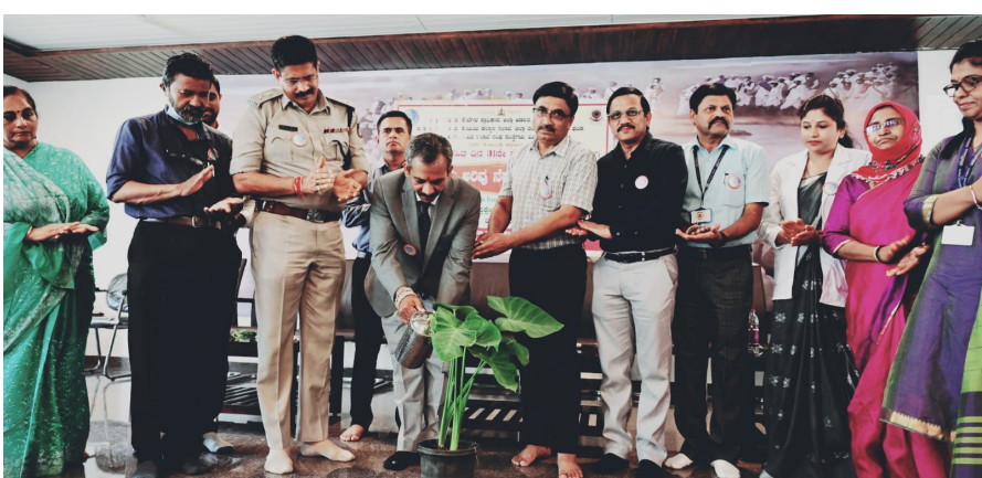
ಮುಖ್ಯ ಗುರುಗಳು ಮತ್ತು ಸಿಬ್ಬಂದಿಗಳಿಂದ ಹಾಗೂ ವಿದ್ಯಾರ್ಥಿಗಳು ಭಾಗವಹಿಸಿದ್ದರು.