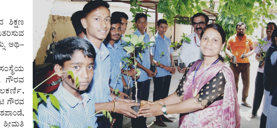
ಮುಖ್ಯ ಗುರುಗಳು ಮತ್ತು ಸಿಬ್ಬಂದಿಗಳಿಂದ ಹಾಗೂ ವಿದ್ಯಾರ್ಥಿಗಳು ಭಾಗವಹಿಸಿದ್ದರು.