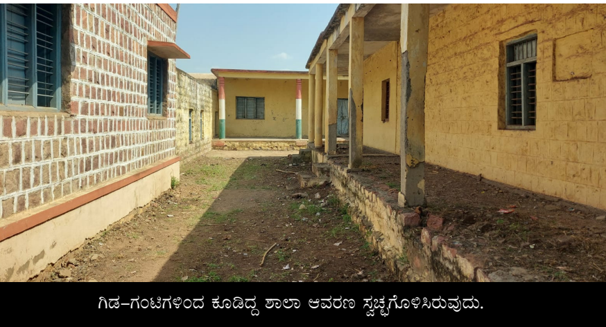
ಗಿಡ-ಗಂಟಿಗಳಿಂದ ಕೂಡಿದ್ದ ಶಾಲಾ ಆವರಣ ಸ್ವಚ್ಛಗೊಳಿಸಿರುವುದು.

ಚಿಮ್ಮಡ: ಗ್ರಾಮದ ಸರ್ಕಾರಿ ಉರ್ದು ಕಿರಿಯ ಪ್ರಾಥಮಿಕ ಶಾಲೆಗೆ ಶಿಕ್ಷಣ ಇಲಾಖೆಯ ಅಧಿಕಾರಿಗಳ ತಂಡ ಬುಧವಾರದಂದು ಭೇಟಿ ನೀಡಿ ಪರಿಶೀಲನೆ ನಡೆಸಿದರು.