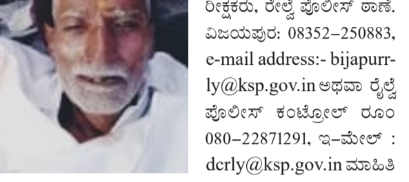
ಪತ್ತೆಯಾಗಿರುವುದಿಲ್ಲ. ಈ ಮೇಲೆ ನಮೂದ ಮಾಡಿದ

ವಿಜಯಪುರ: 08352-250883, e-mail address:- bijapur-ly@ksp.gov.in ಅಥವಾ ರೈಲ್ವೆ ಪೊಲೀಸ್ ಕಂಟ್ರೋಲ್ ರೂಂ 080-22871291, ಇ-ಮೇಲ್ : dcrly@ksp.gov.in ಮಾಹಿತಿ ನೀಡಬೇಕು ಎಂದು ವಿಜಯಪುರ ರೈಲ್ವೆ ಪೊಲೀಸ್ ಠಾಣೆಯ ಪ್ರಕಟಣೆ ತಿಳಿಸಿದೆ.