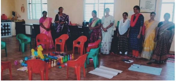
ಮಕ್ಕಳ ಆರೈಕೆ ಕೇಂದ್ರವನ್ನು ವ್ಯವಸ್ಥೆ ಇದರ ಇರುವುದರಿಂದಾಗಿ ಕೇವಲ ಮಾಡಲಾಗಿತ್ತು. ಯಾವುದೇ ಮಕ್ಕಳು ಸಿಬ್ಬಂದಿಗಳು ಮಾತ್ರ ಕಂಡುಬಂದರು.

ಬಸವನಬಾಗೇವಾಡಿ: ಇಲ್ಲಿಯ ಬಸವೇಶ್ವರ ಸರ್ಕಾರಿ ಪದವಿ ಪೂರ್ವ ಕಾಲೇಜಿನಲ್ಲಿ ಲೋಕಸಭಾ ಚುನಾವಣೆಯ ವಸ್ತುರಿಂಗ್ ಕೇಂದ್ರದಲ್ಲಿ ಚುನಾವಣೆಯ ಸಿಬ್ಬಂದಿಗಳ ಮಕ್ಕಳಿಗಾಗಿ ಮಹಿಳಾ ಮತ್ತು ಮಕ್ಕಳ ಕಲ್ಯಾಣ ಇಲಾಖೆಯಿಂದ