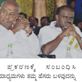
ಪ್ರಕರಣಕ್ಕೆ ಸಂಬಂಧಿಸಿ ಮಾಧ್ಯಮಗಳು ತಮ್ಮ ಹೆಸರು ಬಳಸುವುದನ್ನು 2ನೇ ಪುಟಕ್ಕೆ

ಬೆಂಗಳೂರು: ದೇಶದಲ್ಲೇ ಭಾರೀ ಸುದ್ದಿಯಾಗಿರುವ ಪ್ರಜ್ಞಾ ರೇವಣ್ಣ ಲೈಂಗಿಕ ದೌರ್ಜನ್ಯ ಪ್ರಕರಣದಲ್ಲಿ ಮಾಜಿ ಪ್ರಧಾನಿ ಹೆಚ್. ಡಿ.ದೇವೇಗೌಡ ಹಾಗೂ ಮಾಜಿ ಮುಖ್ಯಮಂತ್ರಿ ಕುಮಾರಸ್ವಾಮಿ ಹೆಸರು ಬಳಸದಂತೆ ಕೋರ್ಟ್ ನಿರ್ಬಂಧ ವಿಧಿಸಿದೆ.