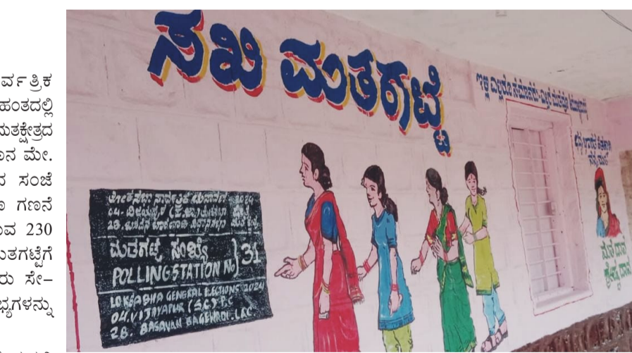
ಸಂಖ್ಯೆ-183 ಅನ್ನು ಯುವಜನ ನಿರ್ವಹಣೆ ಮತಗಟ್ಟೆ ಮಸಬಿನಾಳ ಗ್ರಾಮದ ಸರ್ಕಾರಿ ಕನ್ನಡ ಗಂಡು ಮಕ್ಕಳ ಹಿರಿಯ ಪ್ರಾಥಮಿಕ ಶಾಲೆಯಲ್ಲಿರುವ ಮತಗಟ್ಟೆ ಸಂಖ್ಯೆ-43 ಅನ್ನು ಧ್ಯೇಯ ಆಧಾರಿತ ಮತಗಟ್ಟೆ ಎಂದು ಎಂಟು ವಿಶೇಷ ಮತಗಟ್ಟೆ ಎಂದು ಗುರುತಿಸಲಾಗಿದೆ.

ಬಸವನಬಾಗೇವಾಡಿ: ಸಾರ್ವತ್ರಿಕ ಲೋಕಸಭಾ ಚುನಾವಣೆಯ ಎರಡನೇ ಹಂತದಲ್ಲಿ ನಡೆಯಲಿರುವ ವಿಜಯಪುರ ಮೀಸಲು ಮತಕ್ಷೇತ್ರದ ಲೋಕಸಭಾ ಚುನಾವಣೆಯ ಮತದಾನ ಮೇ. 7 ರಂದು ಬೆಳಿಗ್ಗೆ 7 ಗಂಟೆಯಿಂದ ಸಂಜೆ 6 ಗಂಟೆಯವರೆಗೆ ನಡೆಯಲು ಕ್ಷಣ ಗಣನೆ ಆರಂಭಗೊಂಡಿದೆ. ಮತಕ್ಷೇತ್ರದಲ್ಲಿರುವ 230 ಮತಗಟ್ಟೆಗಳು ಸಿದ್ಧಗೊಳ್ಳುತ್ತಿವೆ. ಮತಗಟ್ಟೆಗೆ ಯಾರ್‌ಪ್, ಬೆಳಕಿನ ವ್ಯವಸ್ಥೆ, ನೀರು ಸೇರಿದಂತೆ ಅಗತ್ಯ ಮೂಲಭೂತ ಸೌಲಭ್ಯಗಳನ್ನು ಒದಗಿಸಲಾಗುತ್ತಿದೆ.