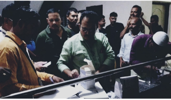
ನಡೆಸಿ ಮುಂಜಾಗ್ರತೆಯಾಗಿ ಮಲೇರಿಯಾ ಮತ್ತು ಪೈಲೇರಿಯಾ ರಕ್ತ ಪರೀಕ್ಷೆ ಮಾಡಿ ಚಿಕಿತ್ಸೆ ನೀಡಲಾಯಿತು.

ಮುದ್ದೇಬಿಹಾಳ: ಲೋಕಸಭಾ ಚುನಾವಣೆ 2024 ರ ಕರ್ತವ್ಯದಲ್ಲಿ ಭಾಗಿಯಾಗಿರುವ ಪೋಲೀಸ್, ಪ್ಯಾರಾಮಿಲಿಟರಿ ಮತ್ತು ಸಶಸ್ತ್ರ ಸೀಮಾ ಬಲ ಯೋಧರಿಗೆ ರವಿವಾರ ಜ್ಞಾನಭಾರತಿ ಶಾಲೆ ಪಕ್ಕದಲ್ಲಿರುವ ಬಿಸಿಂ ಹಾಸ್ಟೆಲ್‌ನಲ್ಲಿ ಮಲೇರಿಯಾ ಹಾಗೂ ಪೈಲೇರಿಯಾ ರೋಗಗಳ ತಜ್ಞಾಸಣೆ ನಡೆಸಲಾಯಿತು.