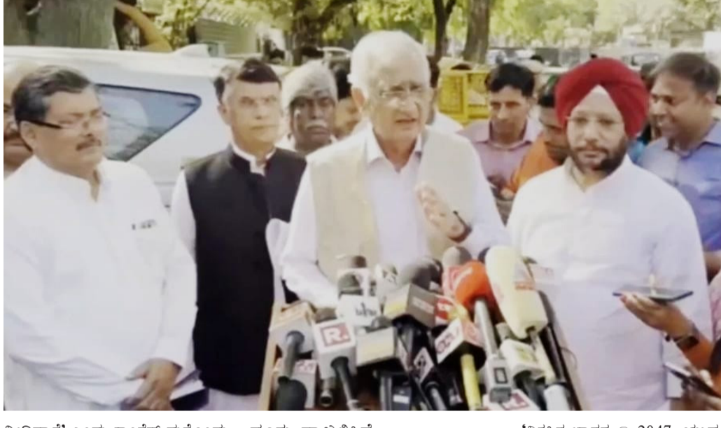
ನೀಡಿದಾರೆ" ಎಂದು ಕಾಂಗ್ರೆಸ್ ಮತ್ತೊಂದು ದೂರು ದಾಖಲಿಸಿದೆ. *ವಿಕಸಿತ ಭಾರತ @ 2047: ಯುವ

ಕೇಂದ್ರ ಸಚಿವ ಮತ್ತು ಬಿಜೆಪಿಯ ತಿರುವನಂತಪುರ ಅಭ್ಯರ್ಥಿ ರಾಜೀವ್ ಚಂದ್ರಶೇಖರ್ ಅವರು 'ಚುನಾವಣಾ ಅಭಿವಿಷಯದಲ್ಲಿ ತಮ್ಮ ಆರ್ಥಿಕ ಸ್ಥಿತಿಗೆ ಸಂಬಂಧಿಸಿದಂತೆ ಸುಳ್ಳು ಮಾಹಿತಿ