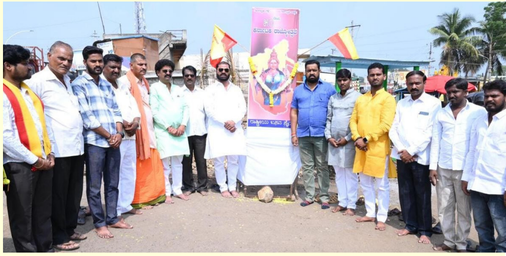
ಗಂಟಿಯಲ್ಲಿ ಸಾಗಿದ ನಂತರ ಸಮಾರಂಭ ಹಮ್ಮಿಕೊಂಡಿರುವ ಬಸವ ಭವನ ತಲುಪಿದ ನಂತರ ಸುಮಾರು ಅರ್ಧ ಗಂಟೆಯ ವಿಳಂಬವಾಗಿ ಸಮಾರಂಭ ಆರಂಭಗೊಂಡಿತ್ತು. ಸಮಾರಂಭ ಭವನದಲ್ಲಿ ಬೆರಳಣಿಯಷ್ಟು ಸಭಿಕರು ಭಾಗವಹಿಸಿದ್ದು ತಾಲೂಕಾಡಳಿತ ಆಡಳಿತ ವೈಖರಿಗೆ ಹಿಡಿದ ಕೈಗನ್ನಡಿಯಾಗಿ ಕಂಡುಬಂದಿತ್ತು.

ಬಸವನಬಾರೇವಾಡಿ: ಪಟ್ಟಣದಲ್ಲಿ ತಾಲೂಕಾಡಳಿತ. ತಾಲೂಕು ಪಂಚಾಯತ ಸಹಯೋಗದಲ್ಲಿ ಬುಧವಾರ ಹಮ್ಮಿಕೊಂಡಿದ್ದ ಕರ್ನಾಟಕ ರಾಜ್ಯೋತ್ಸವ ಕಾರ್ಯಕ್ರಮದಂಗವಾಗಿ ನಡೆದ ಸ್ವಲ್ಪ ಚಿತ್ರಗಳ ಮೆರವಣಿಗೆಯಲ್ಲಿ ಯಾವುದೇ ವಾದ್ಯಮೇಳವಿಲ್ಲದೇ ಕೇವಲ ಟ್ಯಾಕ್ಸ್‌ಗಳಲ್ಲಿ ವಿವಿಧ ತಾಲೂಕುಗಳ ವಿವಿಧ ಮಹನೀಯರ ವೇಷಭೂಷಣ ಧರಿಸಿದ ಮೆರವಣಿಗೆ ಹೊರತು ಪಡಿಸಿ ಯಾವುದೇ ಇಲಾಖೆಯ ಸ್ವಲ್ಪ ಚಿತ್ರಗಳು ಕಂಡುಬಂದೇ ಕಾಟಾಚಾರಕ್ಕೆ ಎಂಬಂತೆ ತಾಲೂಕಾಡಳಿತದಿಂದ ರಾಜ್ಯೋತ್ಸವ ಜರುಗಿತು.