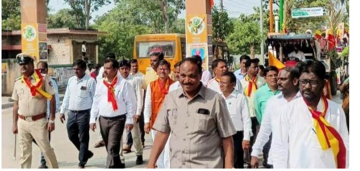
ಗಮನಿಸಿ ನಾವು ಸ್ಥಬ್ಧ ಚಿತ್ರಗಳಿಗೆ ಹೋರಾಟ ನಡೆಸುವ ಅನಿವಾರ್ಯತೆ ಪ್ರಶಸ್ತಿ ನೀಡುವ ಸಂದರ್ಭ ಆ ಎದುರಾಗುತ್ತದೆ ಎಂದರು.