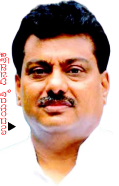
— ಎಂ.ಬಿ.ಪಾಟೀಲ ಜಿಲ್ಲಾ ಉಸ್ತುವಾರಿ ಸಚಿವರು

“ವಿಜಯಪುರದ ವಿಮಾನ ನಿಲ್ದಾಣ- ಕ್ಷೇತ್ರ ಅಂತಾರಾಷ್ಟ್ರೀಯ ಮಟ್ಟದ ಸೌಕರ್ಯಗಳು ಇರುವಂತೆ ನೋಡಿಕೊಳ್ಳಲು ಹಲವು ಉಪಕ್ರಮಗಳನ್ನು ಆರಂಭಿಸಿದ್ದೇನೆ. ಎಲ್ಲವೂ ನಿರೀಕ್ಷೆಯಂತೆಯೇ ನಡೆದರೆ ಮುಂದಿನ 3-4 ತಿಂಗಳಲ್ಲಿ ನಿಲ್ದಾಣವು ಉದ್ಘಾಟನೆಯಾಗಲಿದೆ.”