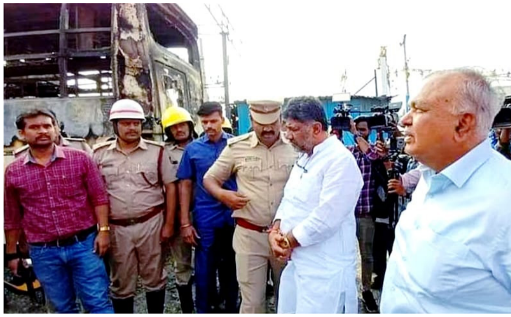
ವಾಹನಗಳನ್ನು ಸೇವೆಗೆ ನಿಯೋಜಿಸಲಾಗಿತ್ತು. ಸುಮಾರು 19 ಬಸ್‌ಗಳು ಸಂಪೂರ್ಣವಾಗಿ